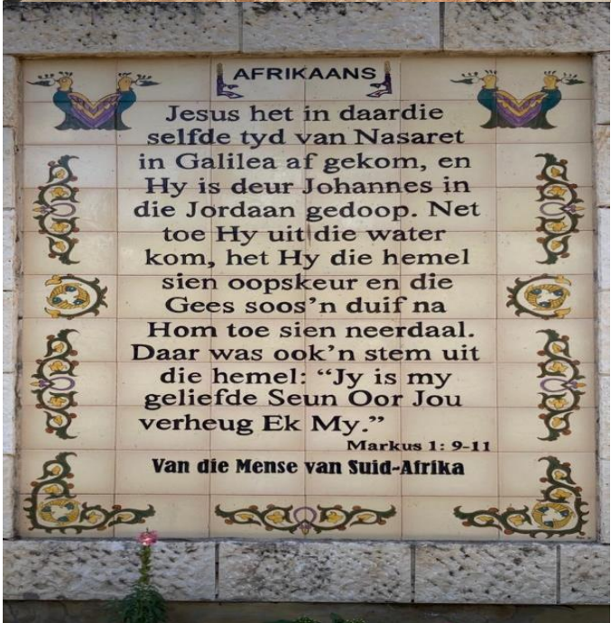
Afrikaans by die Jordaan rivier.