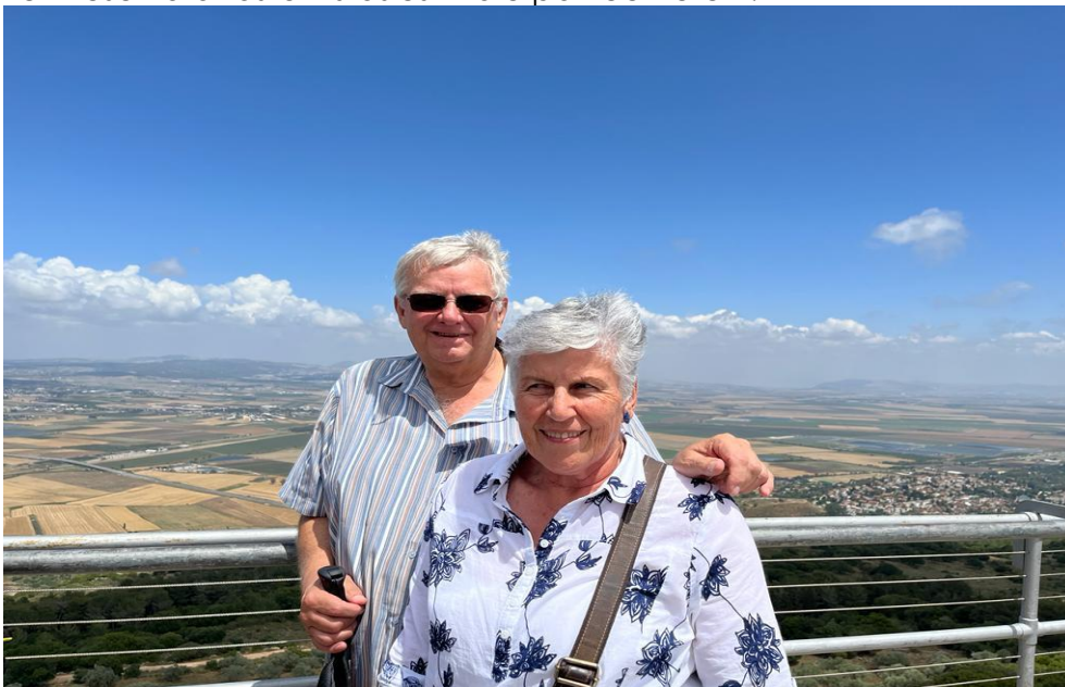
Openbaring 16:16-En hulle het hul versamel op die plek wat in Hebreeus genoem word - Armagédдон.

Ons staan op die uitkyk toring, waar die slag van Armagedon gaan plaasvind.