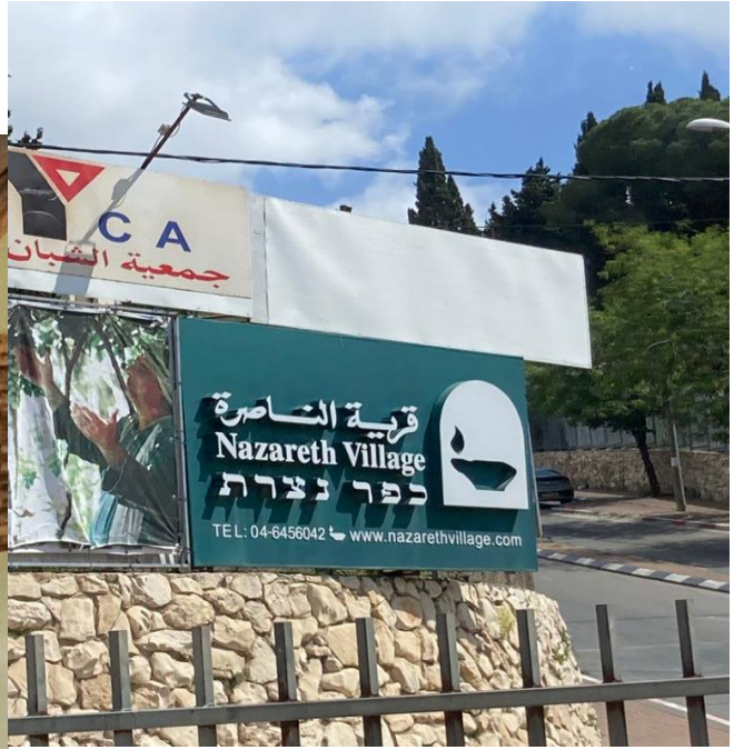
19/05/2023-Nazareth Village is 'n lewendige museum, soos wat dit was in Jesus se tyd.