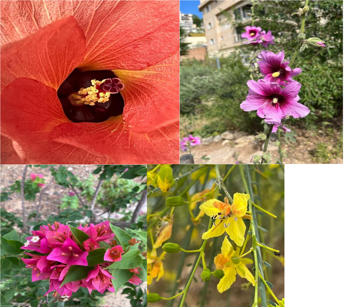
Dit was lente in Israel