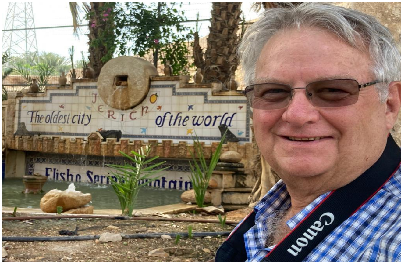
Jericho, oudste stad in die wereld