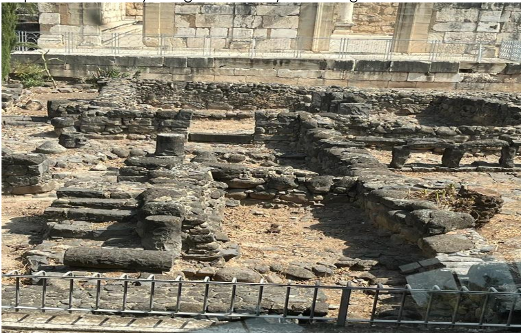
Uitgrawings in Capharnaum

Joh 6:59 "Hierdie dinge het Hy gesê in die sinagoge toe Hy in Kapérnaüm onderrig gegee het." Capharnaum was Sy huis gedurende Sy bediening.