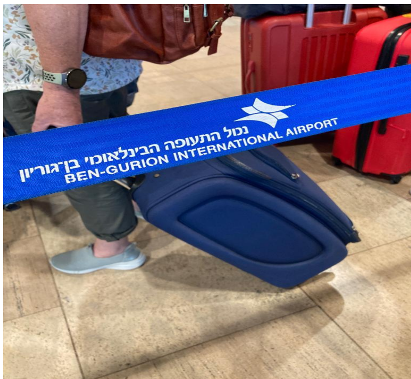
Tel Aviv – Ben-Gurion Lughawe op pad huis toe.

Ek sit nou en huil, soos ek hier tik. Dit was so, so wonderlike belewenis, wat woorde en foto's nooit sal kan beskryf nie. Ons gee net al die eer aan Jesus.