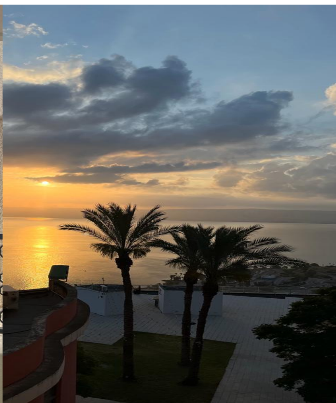
Uitsig vanaf ons kamer in King Solomon Hotel, in Tiberius, by die see van Galilea.