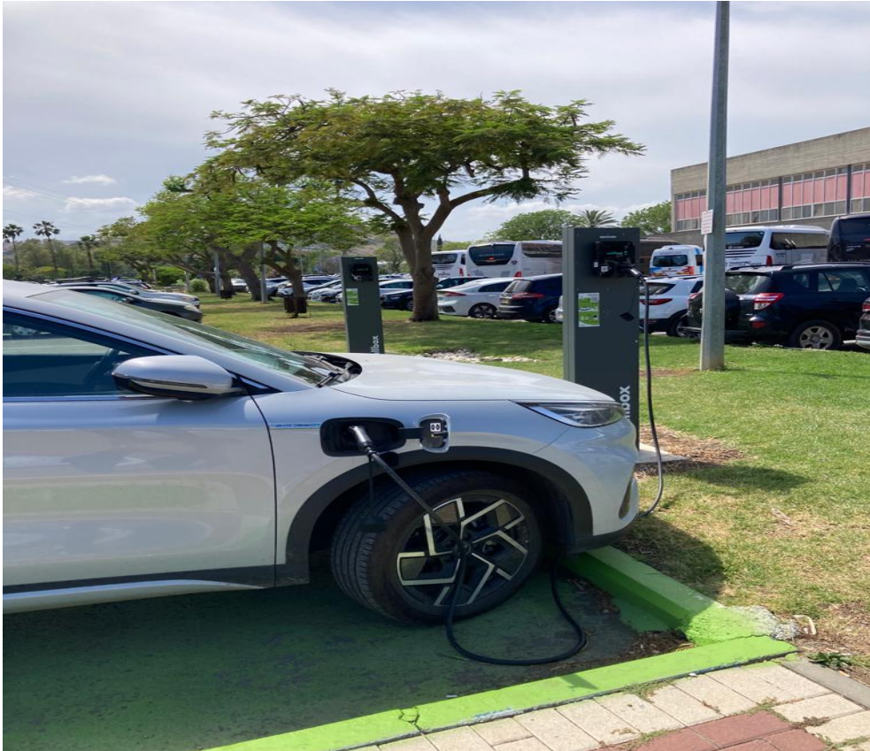
Elektriese “brandstof” stasies in die parkeer terein.