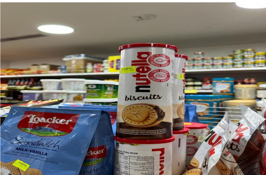
Supermark in Jerusalem, naby die Hotel